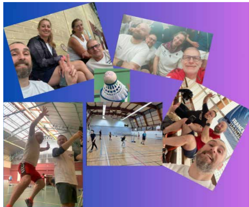
La bonne humeur des Dézingués du volant

Chez « Les Dézingués du volant » on joue au badminton sans prof et dans la bonne humeur, les mardis et jeudis soir, au gymnase.