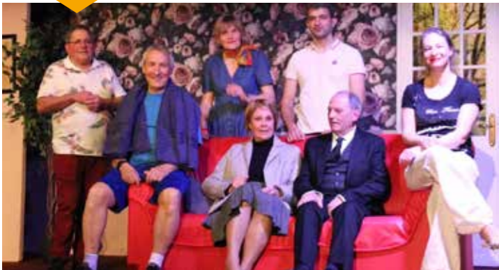
9-10-11-16-17-18 FÉVRIER Théâtre la Compagnole