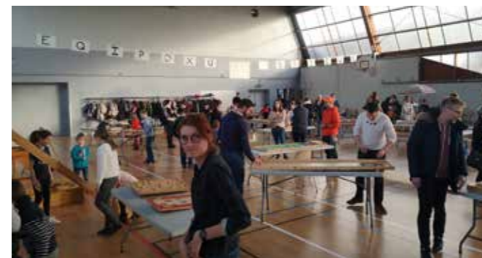
Les jeux en bois sont toujours plébiscités par les petits et grands enfants

Une belle édition de cette manifestation qui fêtait cette année sa 16 e édition, autant dire que cette fête ludique est ancrée dans le programme annuel des familles.