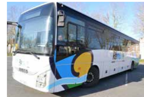
Un réseau de cars pour faciliter le transport scolaire

Les trois circuits desservent le collège Gaston Huet de Vouvray. La navette reliant le collège Gaston Huet au collège Sainte-Thérèse est du ressort de la Région Centre. Inscription pour la navette : www.remi-centrevaldeloire.fr/transports-scolaires/inscriptions . Les familles devront s'acquitter de frais de dossier pour utiliser cette desserte. Les enfants ont aussi la possibilité