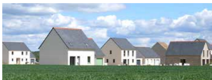
Les premiers logements de la ZAC

Le projet de la ZAC de Logerie avance ! C'est un projet important pour la ville de Parçay-Meslay qui poursuit son développement. Lancé en 2019, ce programme permettra l'implantation, dans sa première tranche, de 78 logements dont un collectif de 19 appartements, 49 logements individuels et 10 logements sociaux. Les premières constructions, qui ont vu le jour, se sont achevées en mars. Ainsi, depuis, de nouveaux habitants prennent progressivement possession de leur logement. D'ores et déjà, ce sont deux familles qui ont emménagé dans notre belle commune. La Municipalité aura plaisir à accueillir ces Parcillons et Parcillonnes nouvellement installés lors de sa traditionnelle cérémonie des nouveaux arrivants qui se déroulera le 27 septembre.