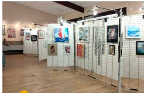
2 AU 10 MARS Salon de peinture Riage