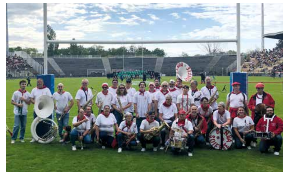
Le groupe de la banda

Enfin, nous vous invitons à notre anniversaire en 2025 où nous fêterons nos 40 ans courant juin ; nous vous tiendrons informés du programme des festivités. ▲