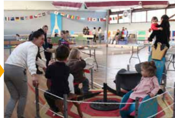
27-28 JANVIER Week-end-Jeux