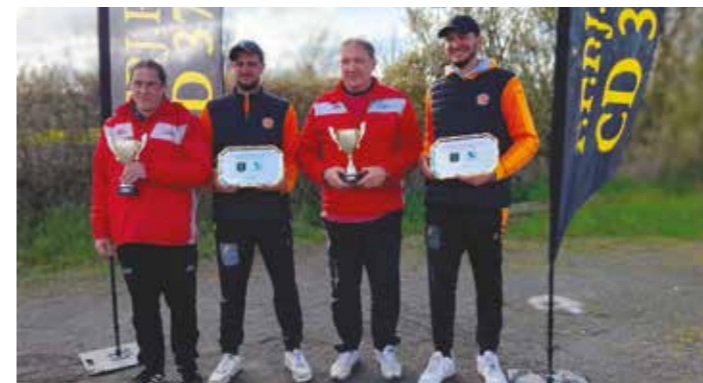
Les champions en doublette provençal