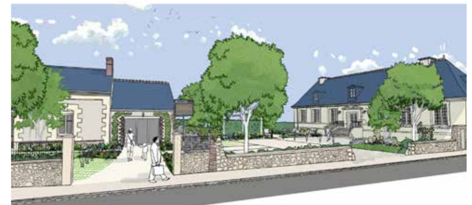
Photo non contractuelle, esquisse du projet en cours d'étude

Un accès entre la mairie annexe et la mairie principale est prévu pour améliorer la circulation piétonne entre les deux bâtiments. Des bancs seront installés pour permettre à chacun de