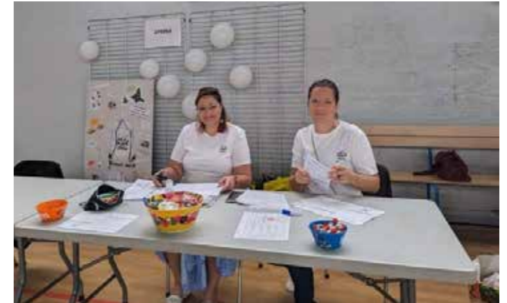
L'APEPM vous donne RDV au prochain Forum des associations

De beaux moments grâce à l'implication de l'équipe des bénévoles et des adhérents. Nous rappelons que les actions orga-