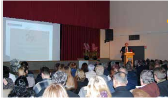
11 JANVIER Cérémonie des vœux