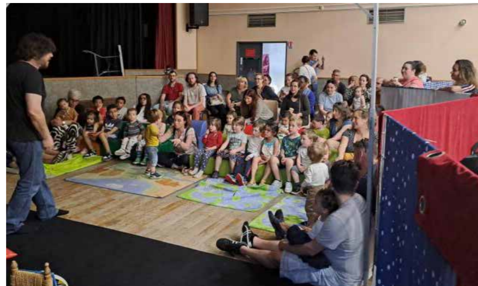
Le spectacle gratuit « La bal(l)ade de Manolo » par la Cie les Chats Pitres

Le Service Enfance Jeunesse a donc proposé deux actions dans ce cadre. Le vendredi 12 avril une soixantaine de personnes se sont réunies pour une soirée « Contes ta Soupe », des cabanes à histoires étaient installées dans la salle des fêtes, des lecteurs ou conteurs avaient sélectionné des histoires du monde pour les enfants et les parents. De plus sept familles avaient préparé des soupes de leurs régions ou pays d'origine afin de voyager également par le goût. Le samedi 13 avril, un après-midi « À vous de jouer - Cultures du Monde » était pro-