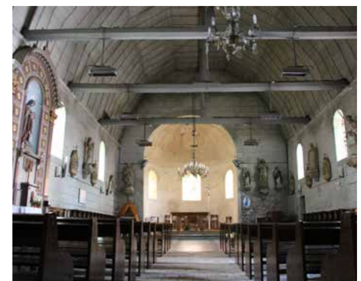
Vue intérieure de l'église.