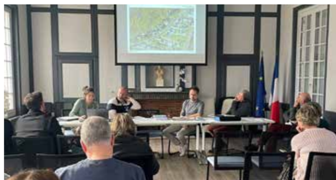
Plan d'une partie du programme (photo 1) Réunion publique avec les riverains, le 2 avril 2024 (photo 2)