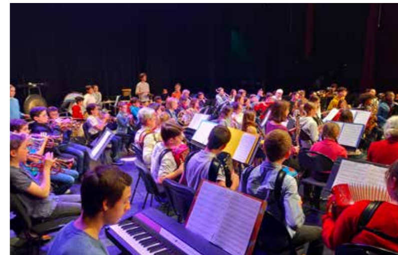
Les concerts de l'orchestre junior