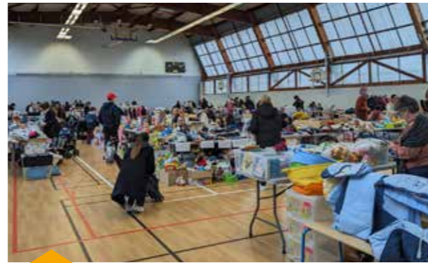
25 FÉVRIER Brocante enfantine