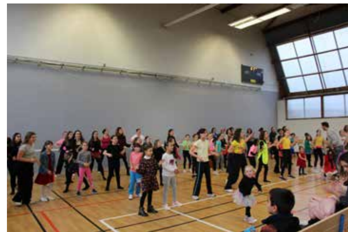
Les représentations lors du Téléthon