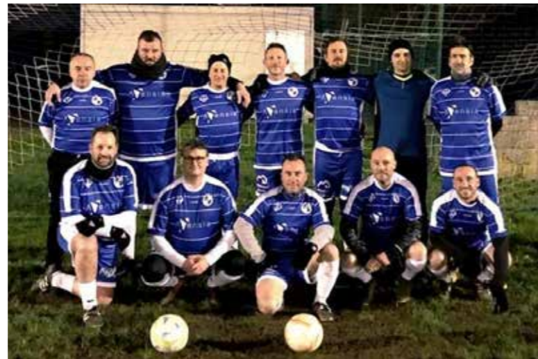
L'équipe de l'APMV

Le sport est un objectif mais il s'accompagne de moments conviviaux et festifs : repas de fin de matchs, week-end « mise au vert », soirées, assemblée de fin de saison... Si vous souhaitez rejoindre notre équipe, notre groupe, contactez-nous. ▲