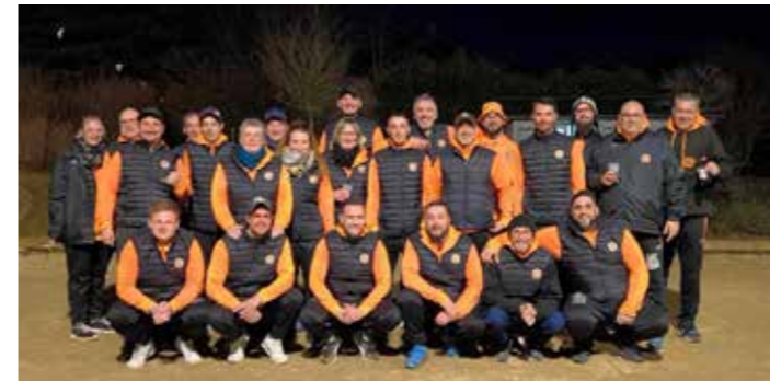
L'APPM au Championnat des Clubs le 10 mars 2024