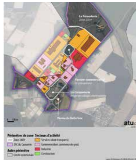
Carte : secteurs d'activité des entreprises de la zone d'activités des Landes du Cassantin

La zone d'aménagement concerté (ZAC) des Landes du Cassantin a été créée en 2006 afin de tirer parti de la proximité de l'échangeur autoroutier de Parçay-Meslay. Parçay-Meslay accueille ainsi quatre des dix plus gros employeurs de logistique présents dans l'agglomération tourangelles. Au total, le parc d'activités du Cassantin abrite actuellement une cinquantaine d'établissements employant 900 personnes. 18 hectares ont été urbanisés entre 2018 et 2023 dans le périmètre de cet espace. Les derniers terrains non construits sont aujourd'hui tous commercialisés. Un village d'entreprises devrait voir le jour à partir de 2025 sur le site de la Carqueterie (sur une emprise de 5 hectares). Deux nouvelles entreprises devraient également s'implanter sur le dernier espace libre