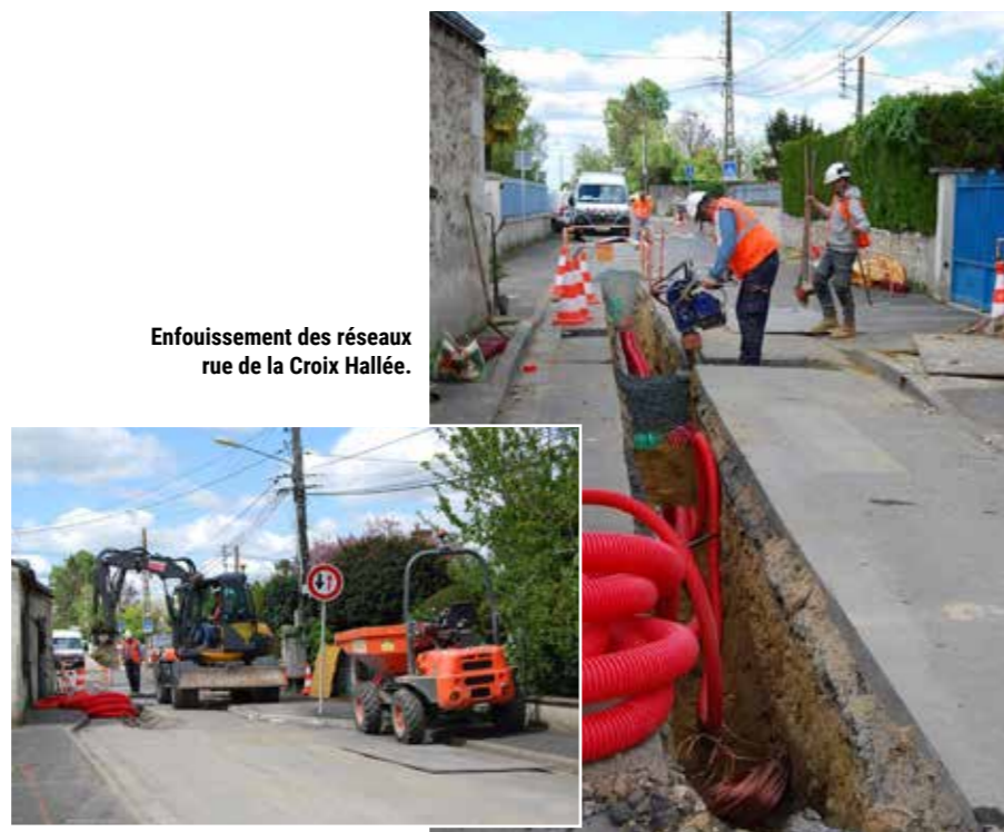
Enfouissement des réseaux rue de la Croix Hallée.

Profitant de cette période de travaux, Tours Métropole Val de Loire interviendra pour la reprise des réseaux d'eau potable et d'assainissement dans ces mêmes rues. L'échéance de leur intervention est fixée à fin juillet. ▲