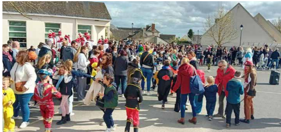
Une fête toujours réussie par la mobilisation des habitants

De sympathiques témoignages reçus ont confirmé la belle réussite de cet événement, rendue possible par le savoir-faire des équipes et par la volonté poli-