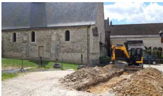
Tranchée derrière l'église Saint-Pierre

Dans le cadre de la ZAC de Logerie, en prévision des futurs logements, comme avant tout aménagement public et privé d'ampleur, l'État a prescrit un diagnostic archéologique préalable pour vérifier si le terrain recèle des traces d'anciennes occupations humaines. L'Inrap de Tours, Centre de recherches archéologiques, a donc réalisé des sondages archéologiques mobiles du 10 au 25 avril 2024 au niveau du parking de la Commanderie et de rue de la Thibaudière. Les fouilles n'ont finalement pas révélé de vestige archéologique d'intérêt.