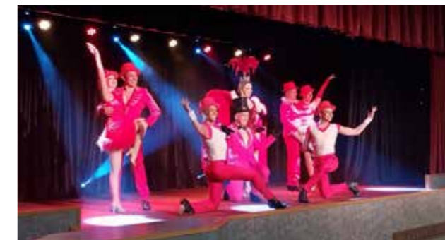
Soirée cabaret « Chez Nello »